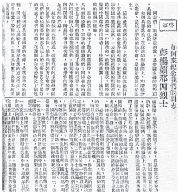
1929年10月12日《红旗》第48期发表有关彭杨颜邢四烈士纪念文章

共“六大”。在总结大革命失败的教训时，他有针对性地指出：“中国革命政权问题，必定要看重军事势力”，政权问题的解决，“军事成分占90%。而解决土地问题，又要求政权问题的解决”。这些思想，深刻揭示了军事工作对政权问题的极端重要性。在党的六届一中全会上，杨殷当选为中央政治局候补委员、候补常委委员，并任中央军事部部长。参与负责党的军事工作。杨殷此时已经进入了中央领导集体，肩负起了领导艰巨的全国革命武装斗争的历史重任。