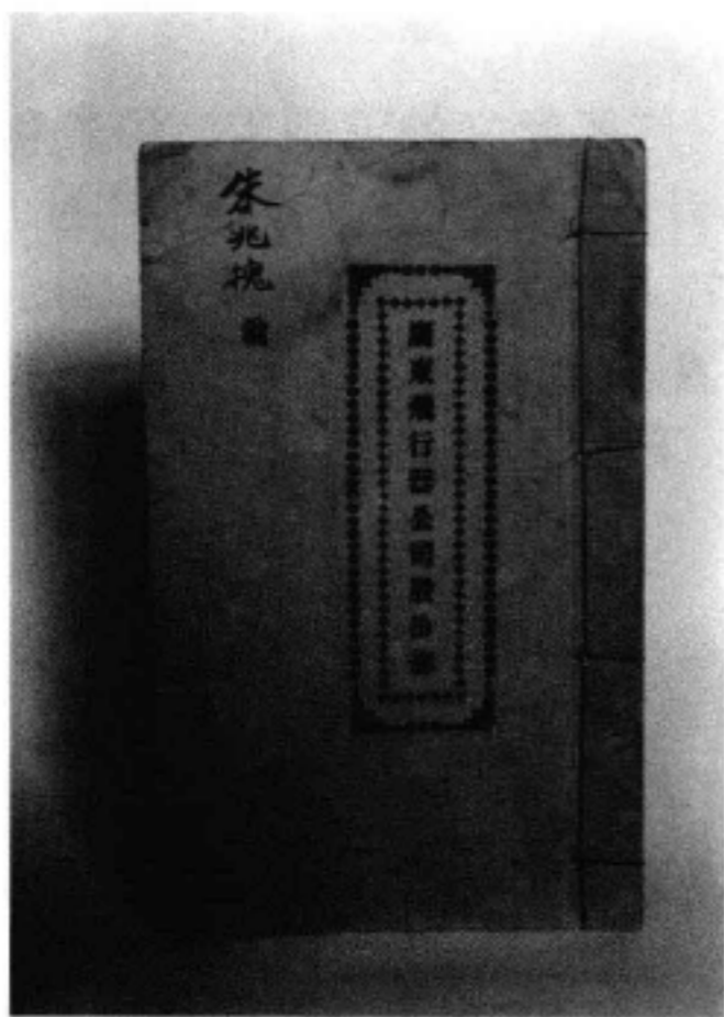
广东飞行器公司股份簿

清 广东飞行器公司股份簿 新闻纸质。纵 13.6 厘米，横 22 厘米，共 9 页。是宣统二年（1910）中国始创飞机的飞行家冯如（详见《冯如墓》条目）和友人在美国筹设广东飞行器公司的股份簿，由其后人冯崇捐赠给广州博物馆藏。