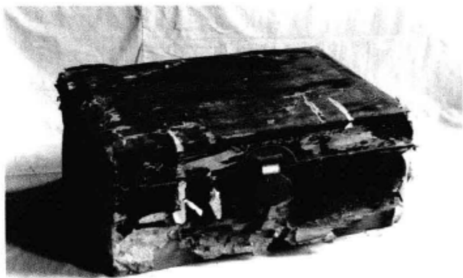
杨殷使用的夹层漆皮箱

民国 杨殷使用的夹层漆皮箱 长52厘米、宽36厘米、高23.5厘米。漆皮，外表黑色，与广东人通行使用的手提小衣箱一样，但箱内底部特制