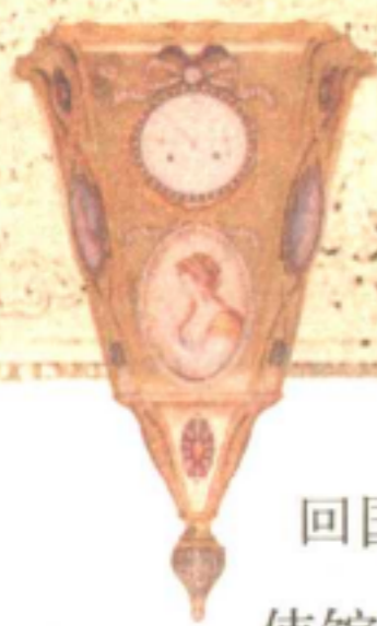
清·铜镀金美人图花插式挂表