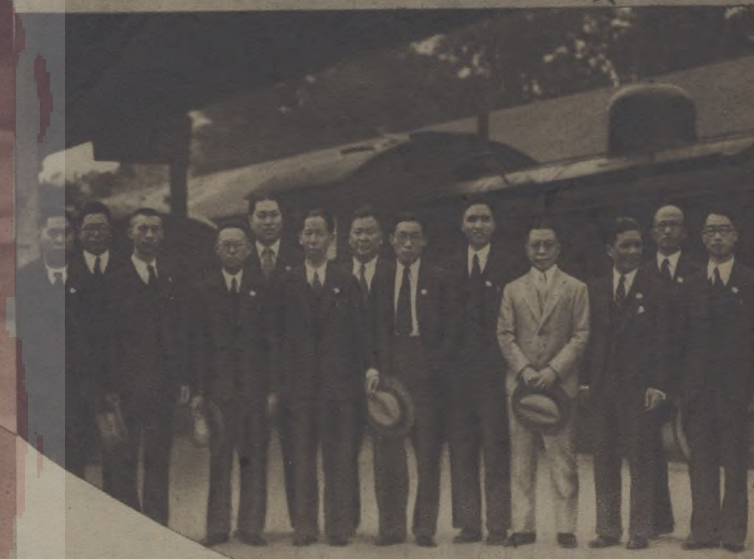
攝李彭車體察赴北圖織皮平氏宋圖 效。站在圖日中下影司津款哲上 禹一合東全考市為。令衛任元為