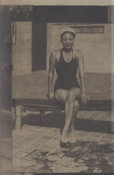
胡比上海市游泳池開放後果行之上海公開游泳 其賽情形，圖上為百五十五公尺自由賽第一 名。