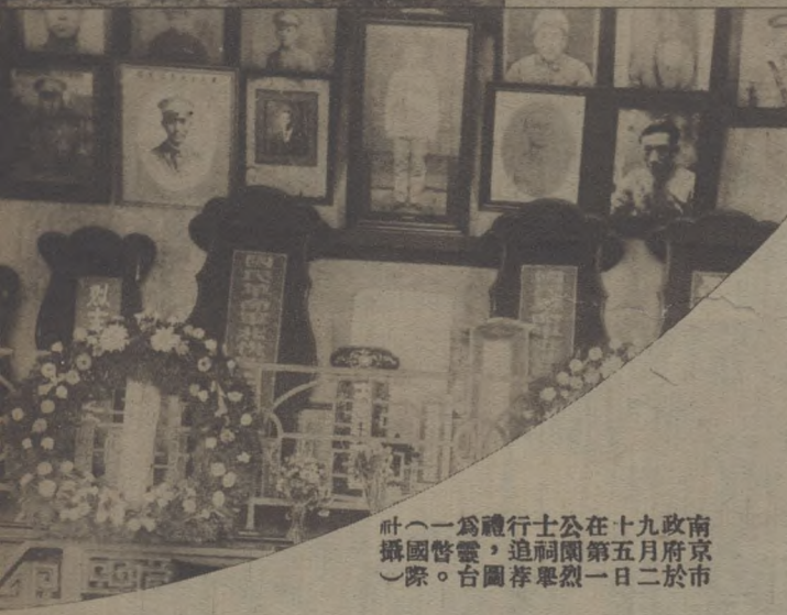
社一為禮行士公在十九政南 攝國警靈，追祠團第五月府京 際。台圖拜舉烈一日二於市