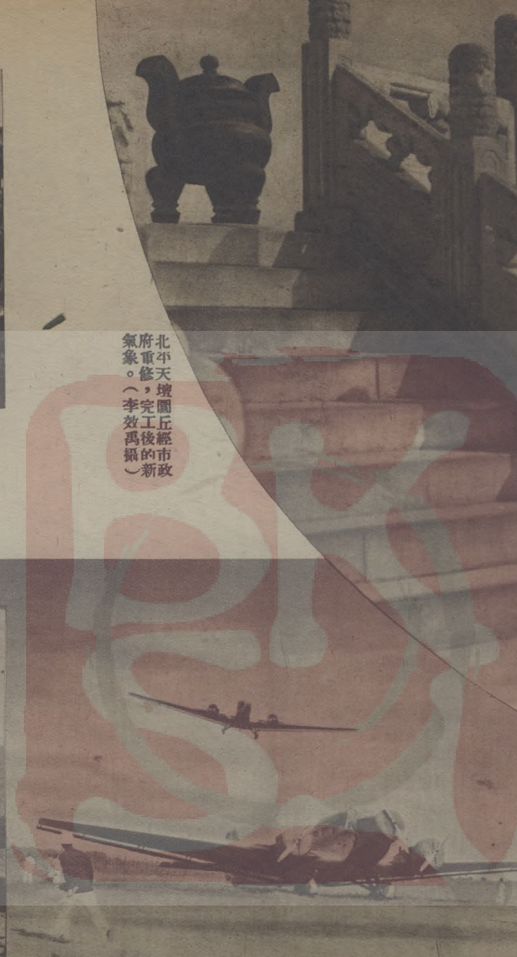
北平天壇園丘經市 府重修，完工後之新 氣象。