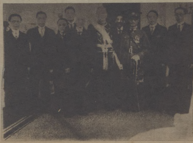
我國首任駐美大使施肇基於 八月廿一日呈遞國書後攝影