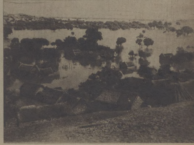
攝際一不數勢之谷北縣銅圖縣數淹北，未黃 社圖退日，水山張東山為，十者被蘇已水