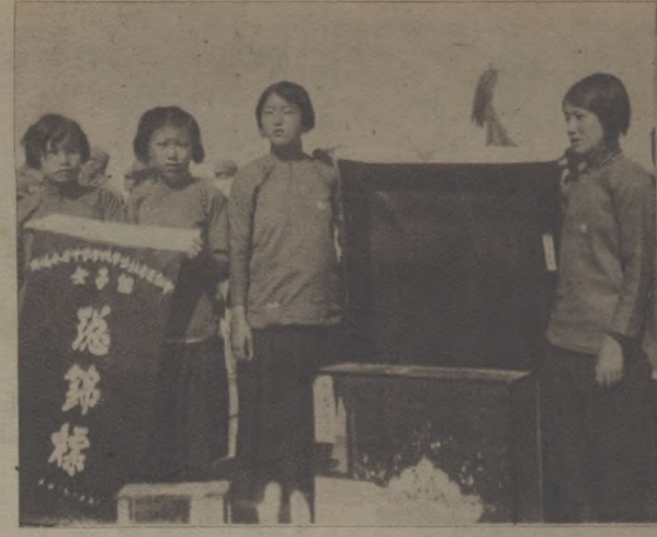
攝令一節之選運屆第參級 德攝。一手會全六加遠