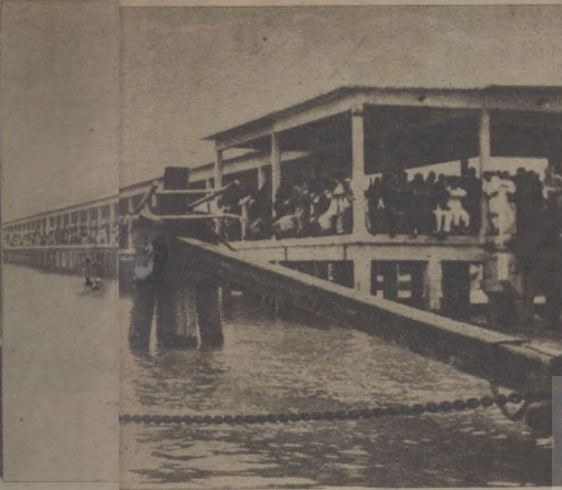
攝迪一湖之兩塘州在 民奕者觀岸江錢杭