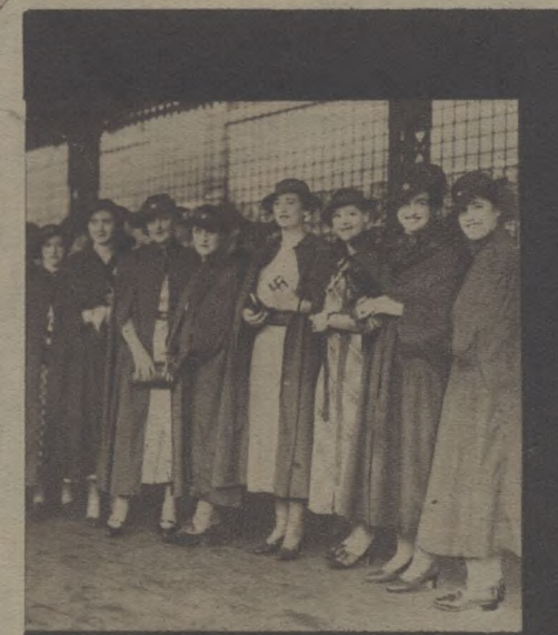
攝寶一攝濕日十九人行團考少澳 基吳影時抵六月於六一察女洲