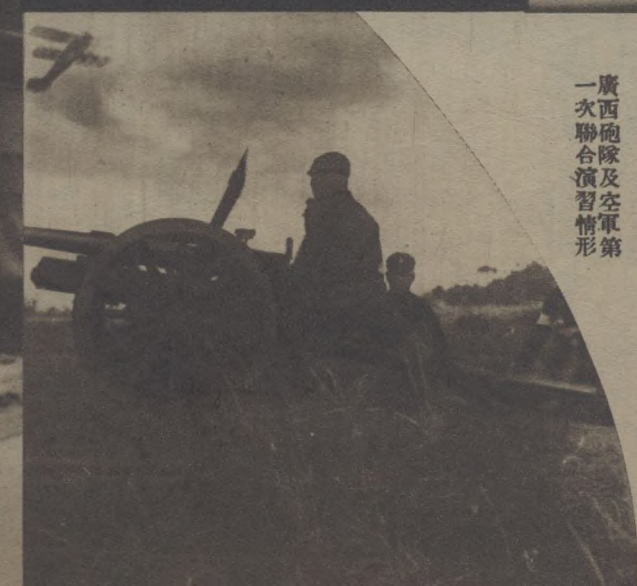
廣西砲隊及空軍第 一次聯合演習情形