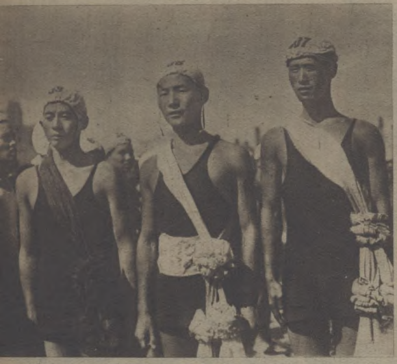
社一節列下標列上幕十於聖全軍一廣 攝遊民。品為類處為。日九會省召集東 東聲一陳，之陳開開月議軍開團第