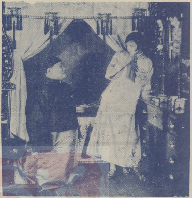
明星公司繼「女兒」後第二部全體演員合作的「落花時節」

對於遊賞不但能 使君倍增興趣兼 試君之運務望諸 君前往一觀無任 歡迎門票每位二 角 本場謹啓 漢界河沿十二號