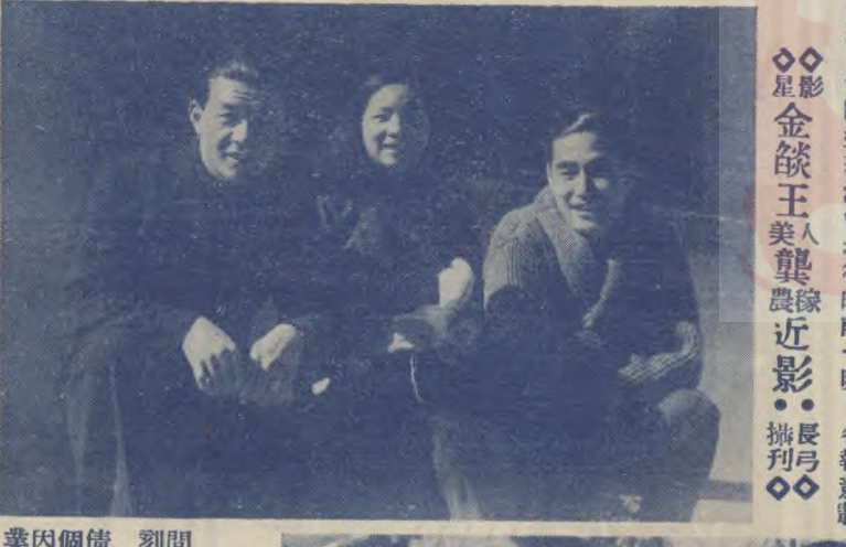
明星「人倫」袁翼錄農：何農

在電影界，金銀幕的明星們總是受到大眾的矚目。他們不僅是觀眾的偶像，也是媒體的寵兒。然而，在光鮮亮丽的背後，他們也承受著巨大的壓力和痛苦。許多明星在成名後，生活變得極其單調和孤獨。他們需要不斷地工作來維持自己的地位，這讓他們沒有時間去享受生活。這種生活狀態，對他們的心理健康造成了嚴重的影響。