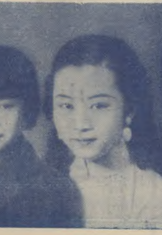
明星「人倫」袁翼錄農：何農