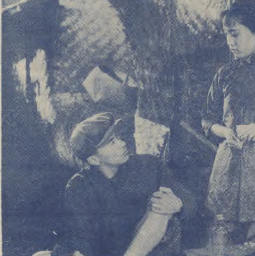
明星「人倫」袁翼錄農：何農

青年，已是很使人注意的。他以前在「三姊妹」中，已經得到絕大的成功。現在，他在一部新的作品中，繼續發揮他的才華。這部作品，不僅在藝術上有了飛躍，也在內容上有了新的突破。導演通過細膩的鏡頭語言，展現了人物內心世界的複雜性。這部作品的成功，無疑是電影界的一個契機。