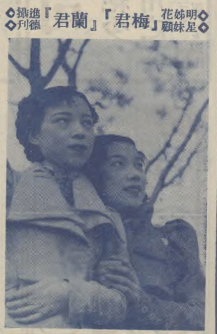
明星公司繼「女兒」後第二部全體演員合作的「落花時節」

這裏所記的電影與兒童，是電影界的女兒，不是普通一般兒童專號。現在，在華北各處，到處可見電影院，因此分析開來，兒童電影的興起，是必然的現象。我們應該怎樣對待兒童電影呢？這是一個值得我們深思的問題。