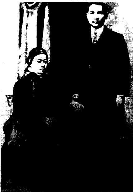
孙中山与陈粹芬合影

1891年，26岁的孙中山在香港学医（差一年毕业，孙科就在此年出世的）。19岁的陈粹芬在屯门基督教堂（美国纪慎会），由陈少白介绍与孙中山相识。初次相见，孙中山即向她表示要效法洪秀全、石达开推翻清朝。出身贫苦的陈粹芬深为孙中山的豪言壮语所感动，崇拜之情油然而